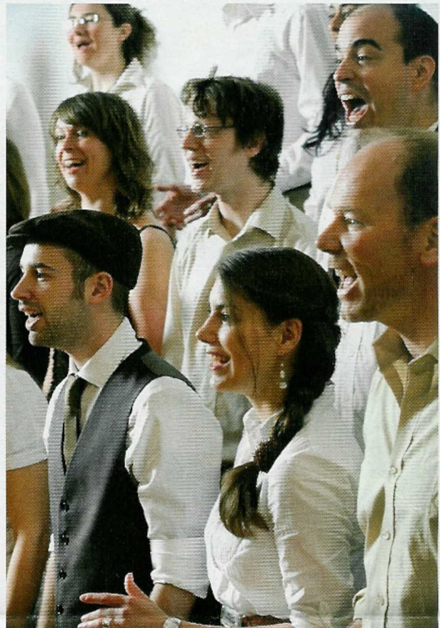
Beschwingtes und geselliges Hobby: Chorsänger verbringen viel Zeit miteinander.